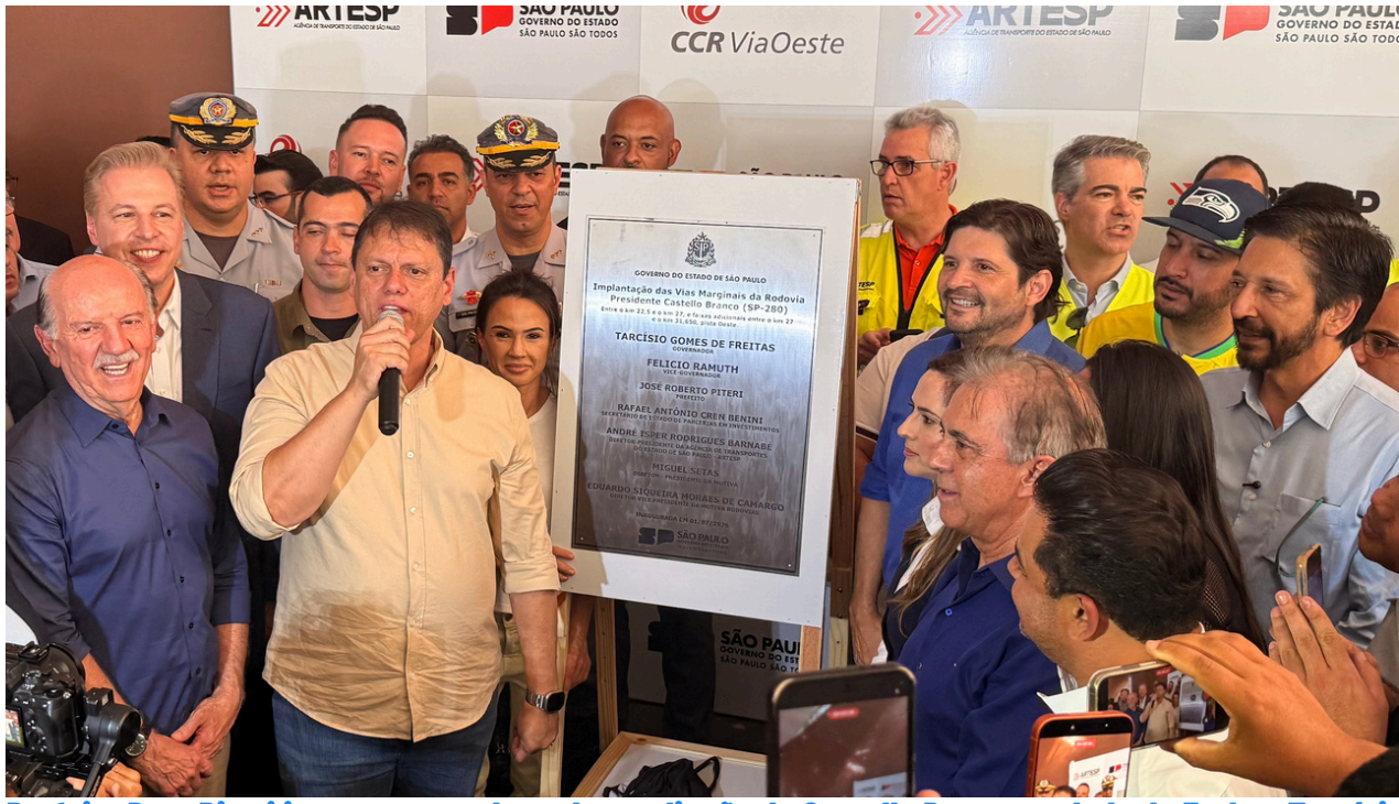
Prefeito Beto Piteri inaugurou as obras de ampliação da Castello Branco ao lado de Furlan, Tarcísio de Freitas, Bruna Furlan, André do Prado, marcando a entrega de uma obra que amplia a mobilidade

Outro destaque é a entrega de novas passarelas para pedestres equipadas com rampas de acessibilidade, piso tátil, corrimãos, iluminação reforçada e dispositivos de proteção, proporcionando mais segurança para quem