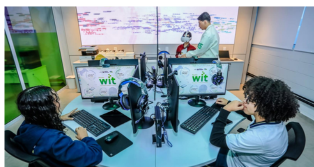
Espaço oferecerá 240 vagas para alunos do Ensino Fundamental II da rede municipal

crianças, jovens e adultos matriculados no programa, incentivando a criatividade, o raciocínio lógico e a qualificação para o mercado de trabalho. Com o novo ambiente, o município reforça o compromisso com a formação de profissionais preparados para as profissões do futuro, com inovação e tecnologia.