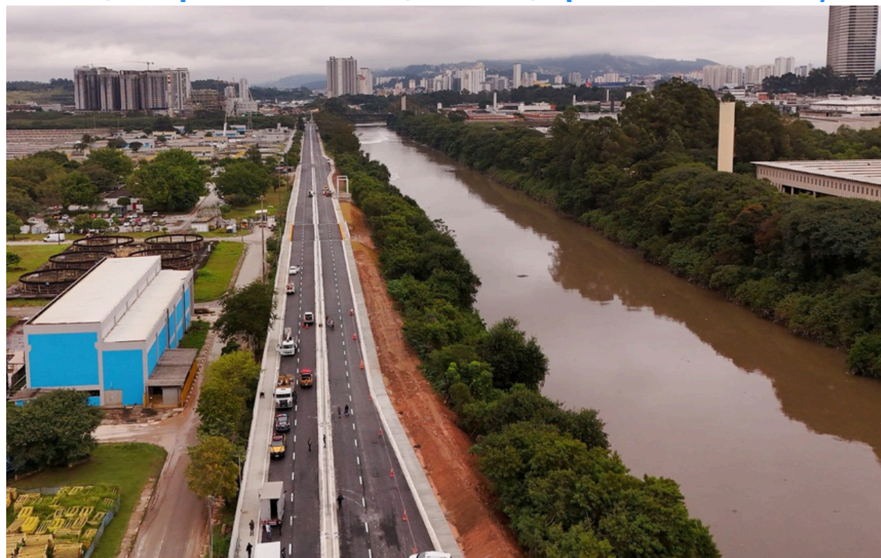
Ao lado de Beto Piteri e Rubens Furlan, o governador Tarcísio de Freitas destacou a parceria com Barueri na entrega da nova Avenida Pirarucu, fortalecendo a mobilidade na região

Corredor Oeste, além de melhorar a circulação de ônibus, veículos de emergência e serviços públicos.