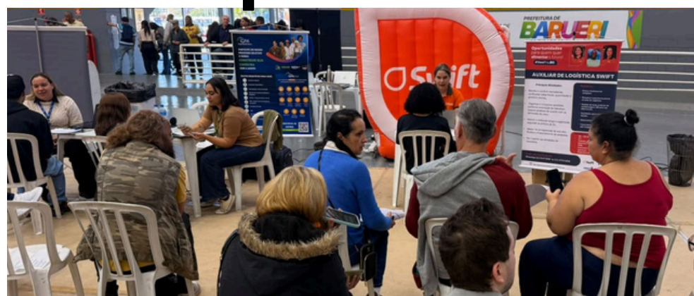
3º Feirão de Empregos ofereceu 2 mil vagas em diversas áreas

A iniciativa reforçou o compromisso da Prefeitura de Barueri com a geração de emprego e renda, aproximando empresas e trabalhadores e ampliando as oportunidades de inserção e recolocação profissional no município, além de incentivar o desenvolvimento econômico e fortalecer o mercado de trabalho local.