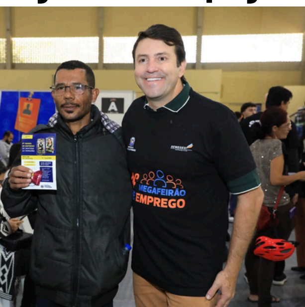
Ação ofereceu oportunidades com salários de até R$ 6 mil e diversos benefícios

O prefeito de Santana de Parnaíba, Elvis Cezar, realizou o 4º Megafeirão de Emprego, que reuniu milhares de pessoas em busca de uma oportunidade no mercado de trabalho. A iniciativa reforça o compromisso da administração municipal com a geração de emprego e renda, aproximando empresas e candidatos em um único espaço e ampliando as chances de contra-