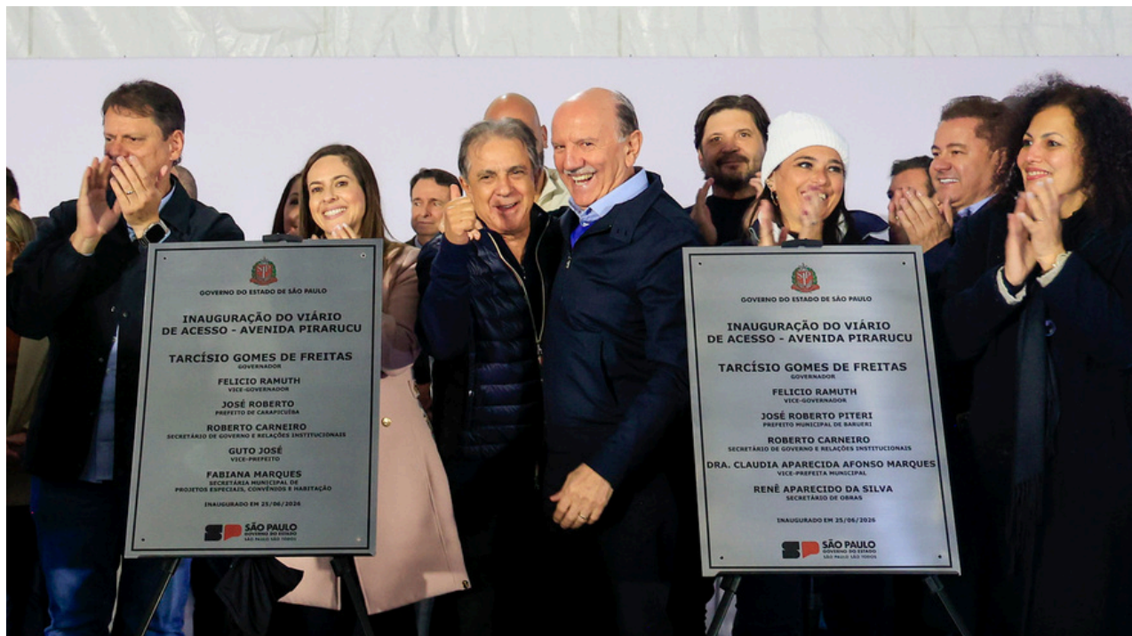
Prefeito Beto Piteri inaugurou a nova Avenida Pirarucu ao lado do governador Tarcísio de Freitas, do ex-prefeito Rubens Furlan, vereadores, deputados e demais lideranças

O investimento de aproximadamente R$ 19,5 milhões permitirá uma transformação na mobilidade entre os dois municípios. A expectativa é de que a nova ligação beneficie mais de 730 mil habitantes, oferecendo uma alternativa à Avenida Deputado Emílio Carlos, reduzindo o tempo de deslocamento, facilitando o acesso ao Km 21 e ao sistema viário do