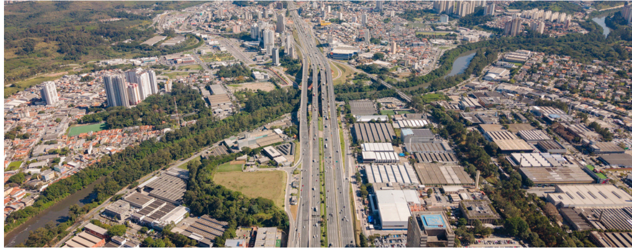
A ampliação da Castello Branco fortalece a mobilidade regional com novas pistas, viadutos e acessos que tornam o trânsito mais ágil e seguro para os motoristas da região