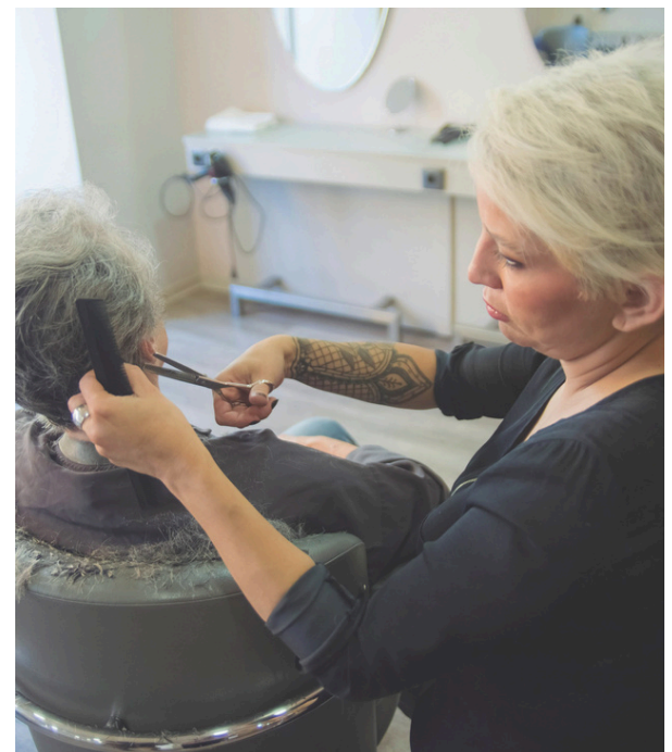
Os cursos serão realizados nos polos da SMMF e no CRAS do Colinas

A Secretaria Municipal da Mulher e da Família (SMMF) de Santana de Parnaíba oferece cursos gratuitos para quem deseja começar o ano se qualificando, com inscrições abertas e aulas a partir de 19 de janeiro. A iniciativa tem o objetivo de desenvolver novas habilidades e incentivar a autonomia e o crescimento econômico dos participantes. Os cursos incluem ma-