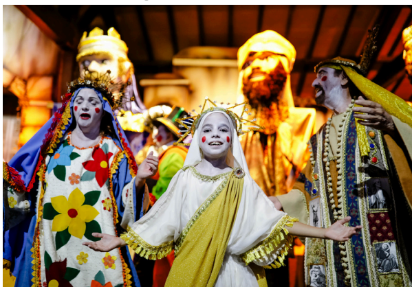
O evento tem atraindo tanto a população local, quanto turistas no município

Em Santana de Parnaíba, a tradicional Folia de Reis continua reunindo moradores e visitantes em uma celebração que mistura fé, cultura e alegria. O evento, realizado com músicas, danças e apresentações teatrais, mantém viva uma tradição secular que marca o período pós-Natal e reforça a importância da comunidade na preservação do patrimônio cultural da cidade.