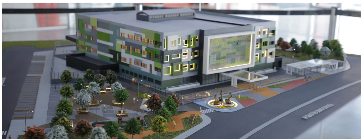
A unidade contará com estrutura completa, incluindo salas de parto, UTI e berçários

Professores (CAP). O contrato da obra prevê prazo de execução de 720 dias, com entrega estimada para agosto de 2027. A maquete do projeto está em exposição no Ganha Tempo de Barueri, na Avenida Henriqueta Mendes Guerra, 550, no Centro.