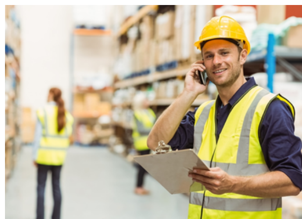
Inscrições abertas na unidade do Polvilho

O Emprega Cajamar segue oferecendo oportunidades de emprego em diferentes áreas, como operacional, logística e transporte, com vagas para auxiliar operacional, motorista escolar e auxiliar de logística. Os salários variam de R$ 1.742,06 a R$ 2.694,52, e os benefícios incluem vale-transporte, cesta básica, assistência médica, seguro de vida, fretado, Gympass e bônus por