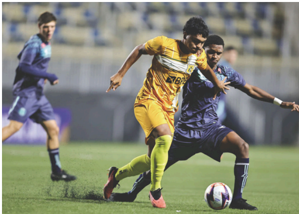
A Copa São Paulo de Futebol Júnior realizou mais um jogo em Parnaíba

Reforçando o compromisso com o esporte, a Prefeitura de Santana de Parnaíba tem investido em iniciativas e melhorias para proporcionar à população competições de alto nível. Um exemplo é o Estádio Municipal Prefeito Gabriel Marques da Silva, inaugurado em 2020, projetado para receber grandes jogos de futebol e eventos esportivos na cidade.