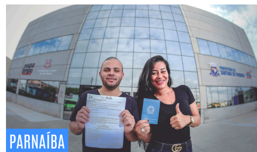
PARNAÍBA Santana de Parnaíba começa o ano com mais de 2 mil vagas de emprego • PAG 9