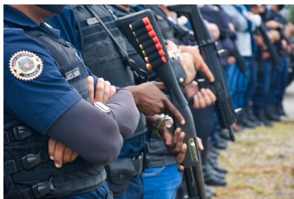
Ações intensificadas garantiram mais tranquilidade à população de Cajamar

A Prefeitura de Cajamar, por meio da Secretaria de Segurança, apresentou resultados positivos da Operação Cajamar Fim de Ano, realizada entre 10 de dezembro de 2025 e 5 de janeiro de 2026. Durante o período, 540 veículos e 768 motocicletas foram fiscalizados, 1.618 pessoas abordadas e 86 veículos irregulares apreendidos, reforçando a organização do trânsito e a segu-