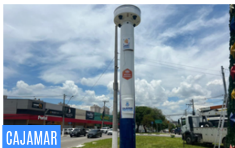
CAJAMAR Smart Cajamar avança com instalação de novos totens de monitoramento • PAG 5