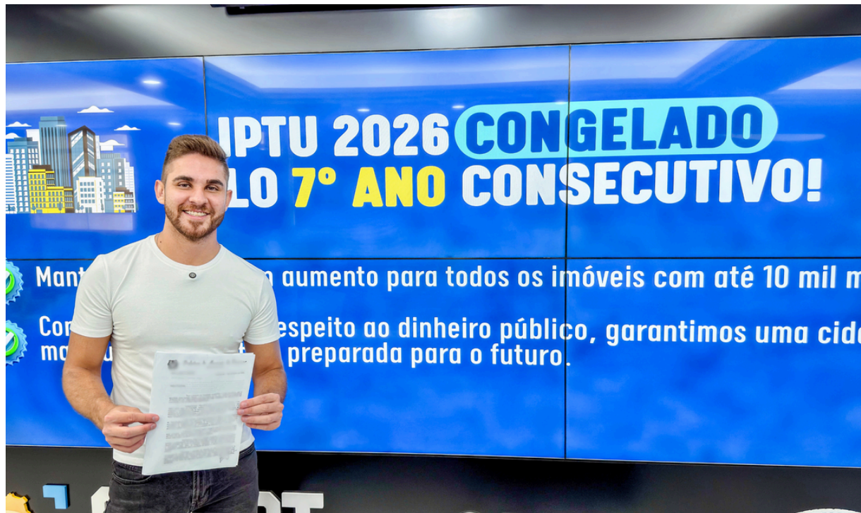
Prefeito de Cajamar Kauan Berto moderniza o atendimento com o IPTU Digital, garantindo praticidade, transparência e sustentabilidade aos contribuintes

O sistema oferece pagamento à vista com até 10% de desconto, além da opção de parcelamento, garantindo mais praticidade, segurança e transparência. A adesão ao IPTU Digital também contribui para a sustentabilidade, com a redução do uso de papel, facilitando o acesso e o controle para todos os contribuintes.