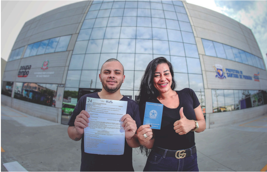
Entre as vagas disponíveis estão assistente administrativo, auxiliar financeiro, chefe de cozinha, consultor de negócios e torneiro mecânico

Santana de Parnaíba começa 2026 com mais de 2 mil oportunidades de emprego disponíveis por meio do Posto de Atendimento ao Trabalhador (PAT), abrangendo diferentes áreas e níveis de qualificação profissional. A iniciativa reforça o compromisso da administração municipal com o desenvolvimento econômico, a geração de renda e o fortalecimento do mercado de trabalho local. Entre as vagas oferecidas estão cargos como administrador de marketing, técnico de suporte de TI, chefe de cozinha, consultor de negócios e conferente de logística,