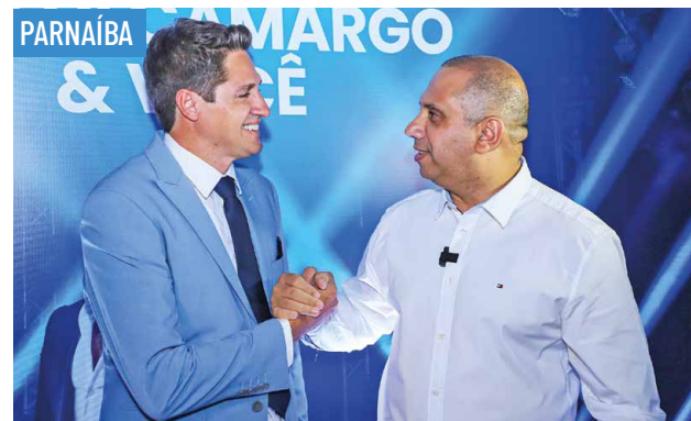
PARNAÍBA Fundação Edmilson arrecada mais de R$ 1,2 milhão com leilões e show de Zezé • PAG 6