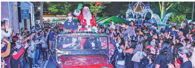
Natal de Luz de Santana de Parnaíba terá presépio, papai Noel, show do tenor Thiago Arancam e Feira da Mulher Empreendedora

A Prefeitura de Santana de Parnaíba, através da Secretaria de Cultura e Turismo, preparou uma programação especial para as tradicionais festividades natalinas. O Natal de Luz 2023 começa no dia 1º de dezembro, às 19h, na Praça 14 de Novembro, Centro Histórico da cidade, com a inauguração do presépio de 200 metros quadrados que está sendo montado sobre uma plataforma de madeira com cobertura de sapê, para celebrar a história do nascimento de Jesus.