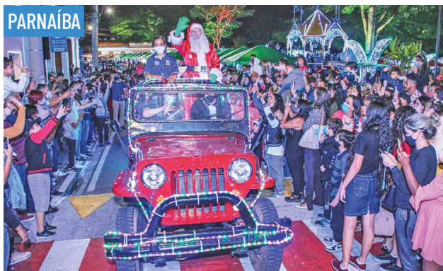
PARNAÍBA Natal de Luz de Santana de Parnaíba terá música, cultura e oportunidades • PAG 3