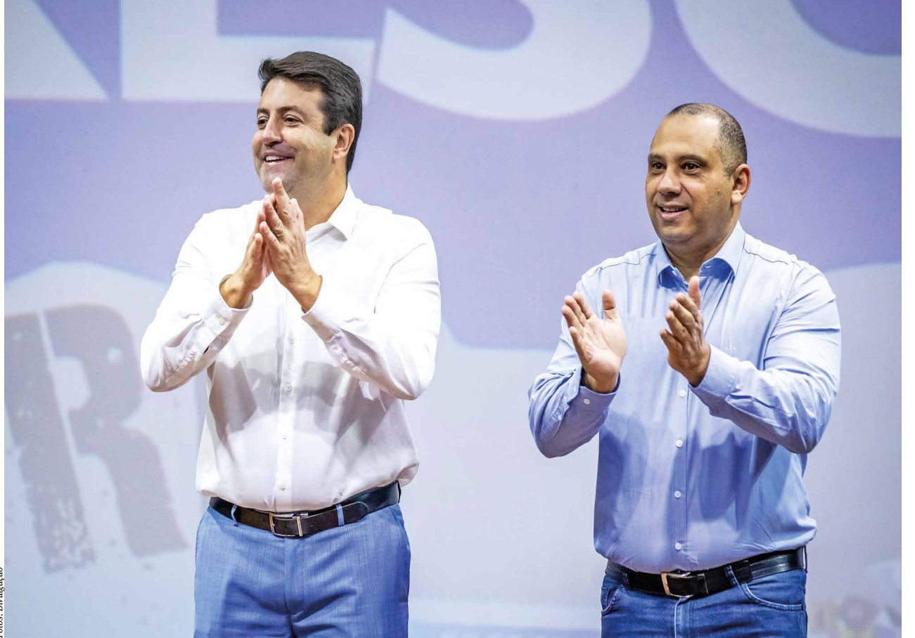
Prefeito Marcos Tonho deu continuidade à política de eficiência fiscal e gestão do ex-prefeito Elvis Cezar

Vale lembrar que, se considerados outros gastos como a compra de insumos e serviços de telefonia e internet, a economia realizada pela administração municipal pode ser ainda maior. Na lista dos imóveis devolvidos, além dos prédios alugados para acomodação das secreta-